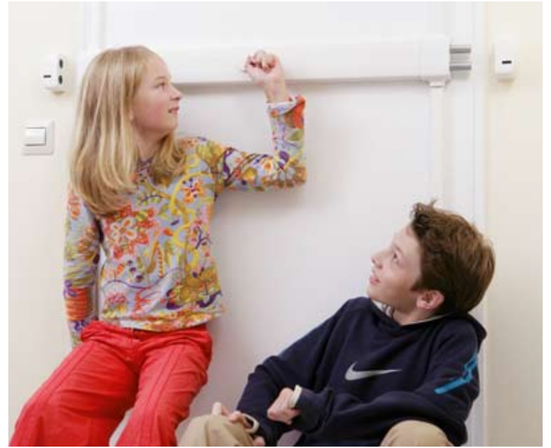
Der IKON-Protectorriegel DRS mit VdS-Anerkennung überzeugt neben seiner einbruchhemmenden Wirkung auch durch sein schönes Design.

Schutzrosette, die den Schließzylinder abdeckt und so vor dem Herausziehen schützt, ist durch die Tür mit dem Protectorriegel unsichtbar verschraubt. „Oftmals hat schon der bloße Anblick einer Zusatzverriegelung an Eingangstüren eine abschreckende Wirkung auf Einbrecher“, so Pfennig. Der Querriegel, der durch ansprechendes Design überzeugt, kann in seiner Standardausführung für alle Türbreiten zwischen 600 mm und 1.200 mm verwenden