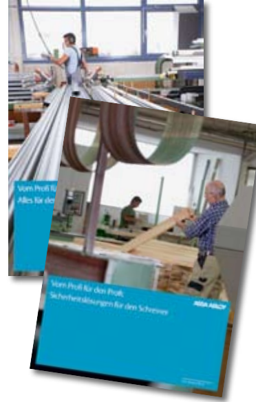
Titel der Verarbeiterbroschüren

finden sich dort auch Maßzeichnungen, technische Daten und Bestellnummern – übersichtlich und klar gegliedert, alles auf einen Blick, professionell aufgemacht für professionelle Ansprüche.