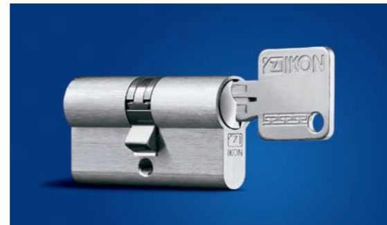
IKON Schließzylinder-System SK6-Meisterwerk der Präzision und Hightech-Mechanik.

Eine mechanische IKON-Schließanlage der ASSA ABLOY Sicherheitstechnik GmbH, die sowohl auf die interne Organisationsstruktur des Objekts als auch auf die architektonischen Gegebenheiten und denkmalgerechten Anforderungen eingeht, wurde für das Gebäude maßgeschneidert. Außerdem trägt der hierarchische Aufbau der Schließanlage im Vectorprofil den Ansprüchen der Objektbetreiber im Hinblick auf Flexibilität Rechnung.